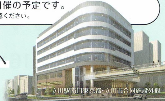
立川駅南口東京都・立川市合同施設外観